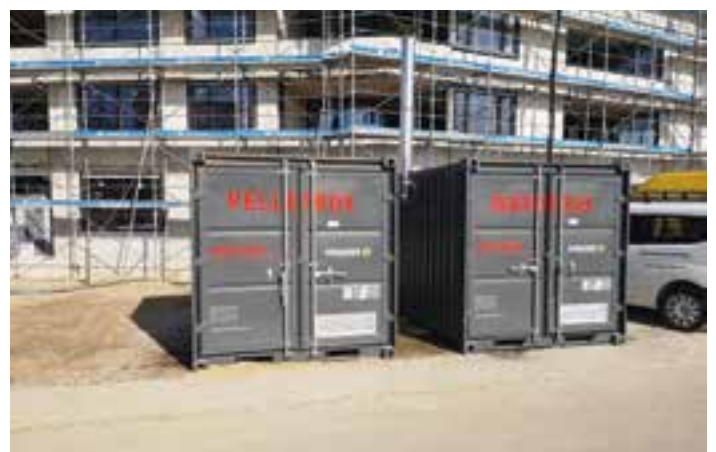
Power-Box mit Pellets-Lager-Container auf der Baustelle installiert für die Bauaustrocknung.