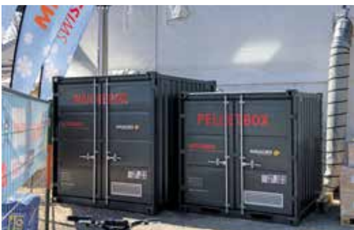
Mit dieser Power-Box wird ein Festzelt beheizt. Die Heizung ist in einem 10 Fuss Container, die Pellets sind in einem 8 Fuss Container.