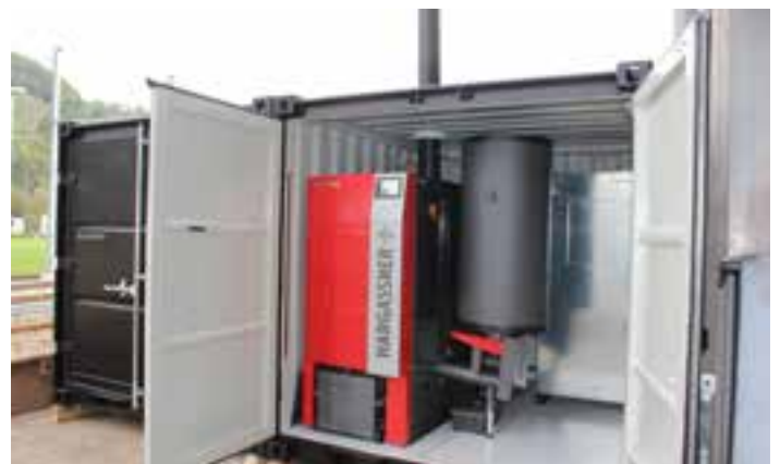
Power-Box 120 mit Pelletsausführung zur Beheizung einer Lagerhalle