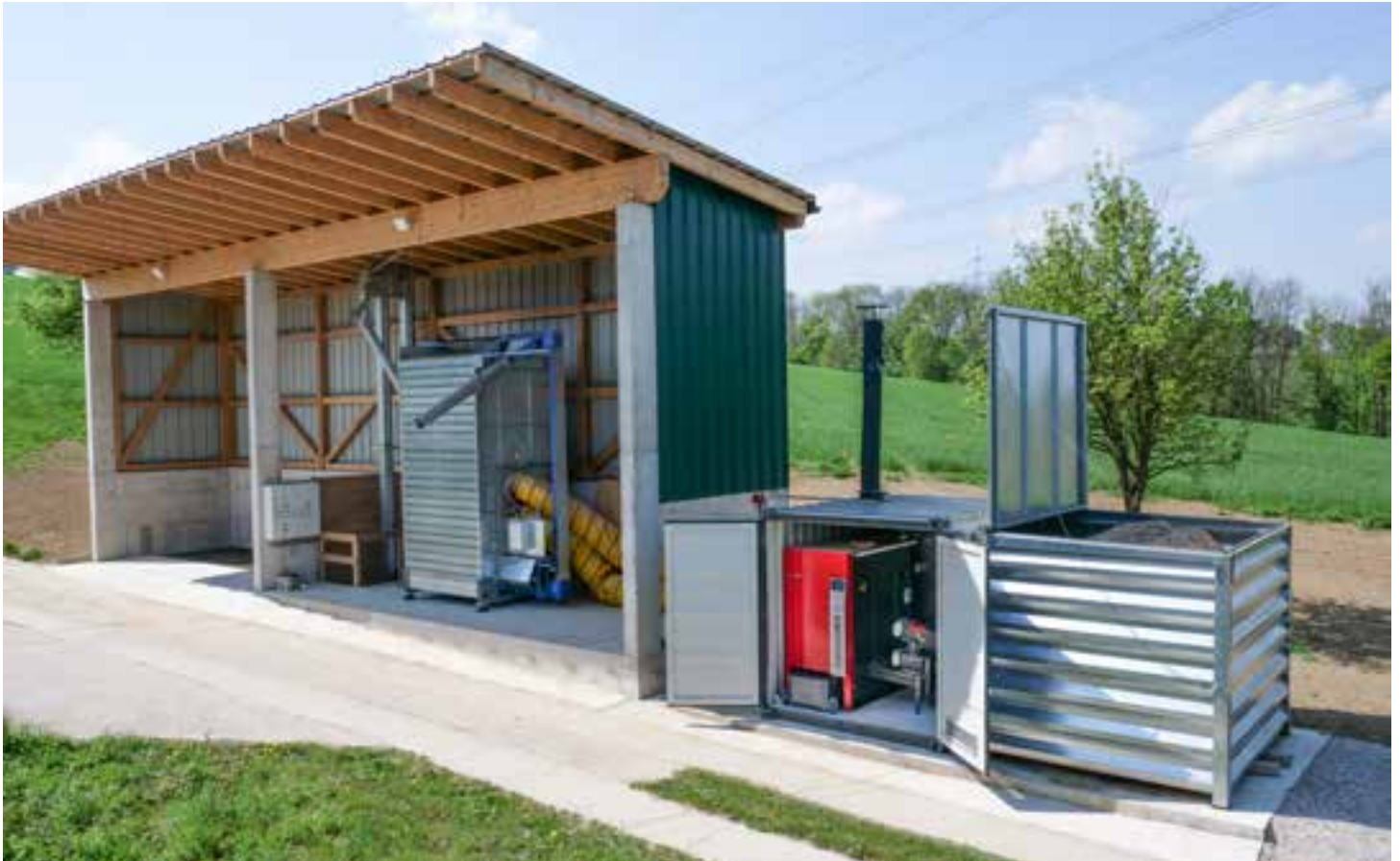
Eine Hargassner Power-Box 200 mit einem Hackgutlagermodul für 15 SRM beheizt einen Umlauftrockner für Mais und Getreide